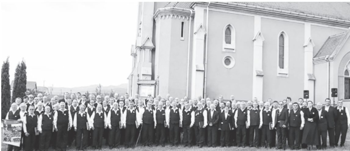
A Száztagú Székely Férfikórus Csikborzsován