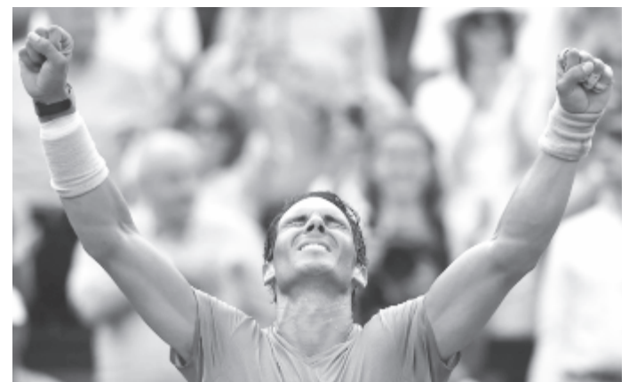
Rafael Nadal 79. tornáján diadalmaskodott, és 17. Grand Slam-trófeáját gyűjtötte be

* A világszínvonalú Rafael Nadal megnyerte a francia teniszbajnokság férfi egyes versenyét, mivel a vasárnapi döntőben 6:4, 6:3, 6:2-re legyőzte Dominic Thiemet. A spanyol sztár 2:0-lal kezdett, majd a ranglistán nyolcadik ellenfele egyenlített, csak hogy 5:4-nél ismét elvesztette az adogatását és ezzel együtt a szettet is. A folytatásban a mallorcai teniszese rögtön brékelt, és előnyét megtartva szűk két óra elteltével már kétjátékos előnyben volt. A harmadik felvonásban Nadal kétszer is ápolást kért görcsölő ujjára, de ez nem akadályozta meg abban, hogy kétszer elvegye ellenfele adogatását, és végül magabiztosan nyerjen. Nadal 11. alkalommal emelhette a magasba a Muskétások Kupáját, 79. tornáján diadalmaskodott, és 17. Grand Slam-trófeáját gyűjtötte be. Így már csak hárommal van lemaradva a GS-örökranglistát vezető Roger Federertől.