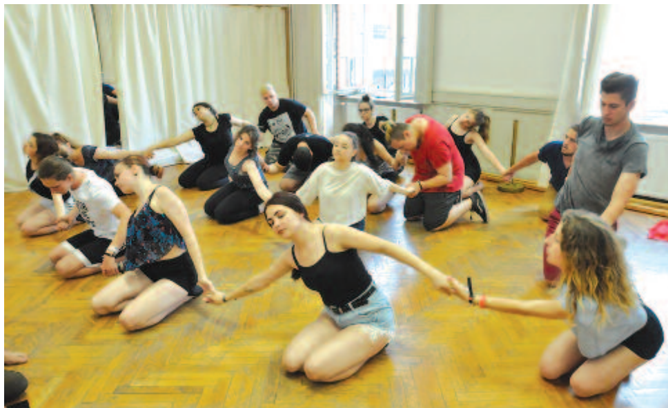
A közös próbán

Közismert, hogy Marosvásárhely igen jó kapcsolatot ápol Kecskeméttel, és ezt az önkormányzatok közötti hivatalos szerződés