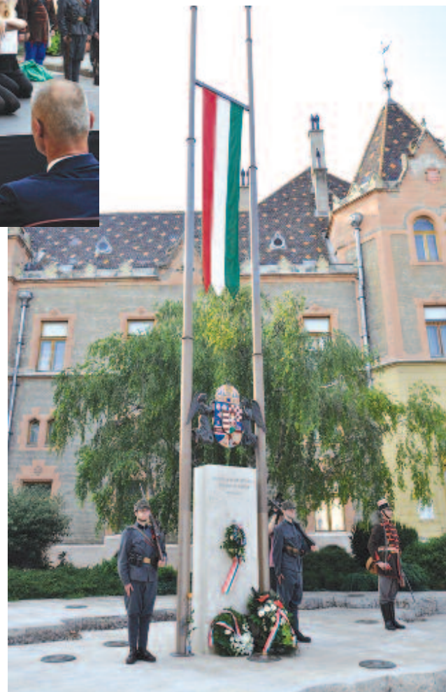
Koszorúk az Összetartozás (Országzászló) emlékművénél

Az ismerkedési gyakorlatokon az egyik kecskeméti diák őszintén feltette a kérdést: miként élnek meg magyarságukat a határon túliak? Válaszként érdekes beszélgetés alakult ki, amiből kiderült, hogy a politikum a határ mindkét oldalán hamis képet fest erről. A történelem, a Trianon utáni idők ideológiai csatározásai miatt belénk ivódottak bizonyos reflexek, amelyekről nehezen szabadulunk. Pedig ott lent, a mélyben roppant egyszerűek a tények, legalábbis a diákok így látják. Mert határtól függetlenül vannak jó-rossz tanárok, olyan menő együttesek, amelyeknek a dalszövegét az első zenei hang után együtt dúdolták. Nem kellett különleges gyakorlat a hangszerműzeumbeli jamm-sessionhoz. Vannak engedékeny és szigorú szülők határon innen és túl, egyszerű emberek, akik örülhetnek egymásnak, akkor is, ha addig sohasem találkoztak. Ahogy az egyik bulin elhangzott (volna): az élet jó buli, csak élni, megélni tudni kell! És érdemes. Így. Trianontól függetlenül a történet folytatódik. Remélhetőleg ez az idei közös munka is, netán jövőre éppen Marosvásárhelyen. Mert kell!