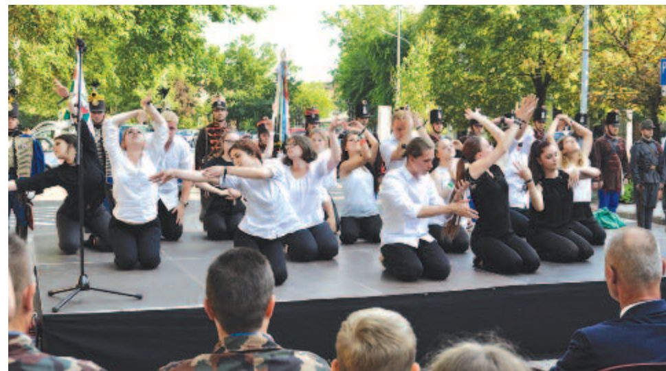
A kecskeméti főtéren megemlékezés színpadán

Nem volt nehéz egymásra találni, hiszen az elképzelés szerint a diákokat kecskeméti diákok családja látta vendégül, és ez már az indulás előtt kiderült, úgyhogy már az odaérkezés előtt tisztázták, hogy kinek mi a zenei preferenciája, mit fogyaszt szívesen, de még az is világossá vált, hogy milyen színű törülköző a kedvenc. S hogy a munka is menjen, a szövegek forgatókönyve is megérkezett idejében, így a hosszú út alatt lehetett részleteket tanulni belőle. Három és fél nap állt rendel-